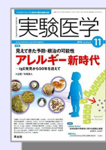
『実験医学 Vol. 34 No. 18 2016』 医学分館1F 製本雑誌（和）

このように(?)研究をする醍醐味はたった1つの論文でこれまでの世界観を変えることが可能なことです。興味がある方は一緒に研究しましょう。免疫学やアレルギーについて興味をもった人のために山梨大学の図書館にある雑誌と本を1冊ずつ紹介しておきます。2冊とも私が関係しているので、図書館で借りたり、出来ればアマゾンでクリックしてもらえるととても嬉しいです（ただし印税は一切入りませんが）。