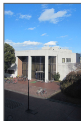
● 表紙：医学分館 場所：医学部

本館及び医学分館は、山梨大学以外の大学生をはじめ一般の方々も利用できます。詳細については、 https://lib.yamanashi.ac.jp/ をご覧ください。本館 Tel:055-220-8066（情報サービスグループ）、医学分館 Tel:055-273-9357（医学情報グループ）にお問い合わせください。