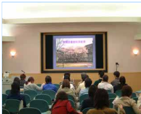
マルチメディア多目的ホール