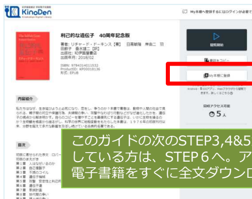
電子書籍詳細画面例 (試し読みが表示される電子書籍はMy本棚に登録はできません)

このガイドの次のSTEP3,4&5が既に完了している方は、STEP 6へ。アプリから電子書籍をすぐに全文ダウンロードできます。