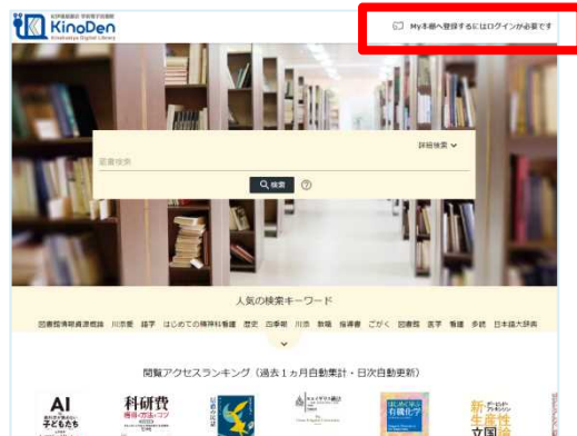
トップ画面からもログインできます。

(注意) 定期的にブラウザからKinoDen電子図書館サイトへのアクセスが必要です。 ※KinoDen 電子図書館サイトに長期間アクセスしていない場合は、アプリから電子書籍を開くときに(Step6参照)、KinoDen 電子図書館サイトへのアクセスとbREADER Cloudアカウントへのログインが必要となります。