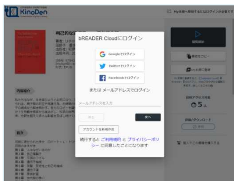
bREADER Cloudアカウント作成・ログイン画面例 Google, Twitter, Facebookアカウントも利用できます。